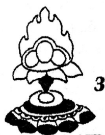
Рис. 1. а - "Небесная пара" среди десяти тамг. Подкамень (фрагмент). б - "Небесная пара" на плите с косым уклоном, Кандеевский лог. (фрагмент). в - "Небесная пара" с тремя точками в круге, Барстаг. г - два знака "Небесная пара" и антропоморфная фигура, г. Ключинская. д - Ассирийский священник по Аспелину. е - одиночная фигура, Борбаковы горы (фрагмент). ж - первая фигура из четырех в короне с солярным знаком на лбу, Барстаг, фрагмент. з - "Три драгоценности" Н.И. Klimkeit, 1998, fig. 27.